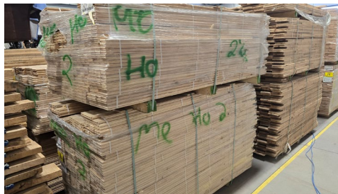
Merisier Horizon 2" 1/4