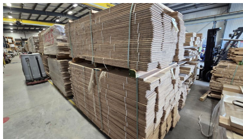
Chêne rouge 7" 1/2