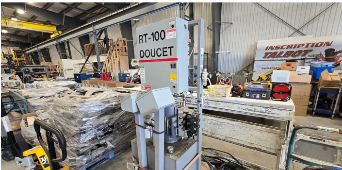
Robot de serrage Doucet, mod. RT-10012.5-38-W-S, série 2021-06-051, 2021

725, rue Rossiter, St-Jean-sur-Richelieu (Qc) J3B 8A4