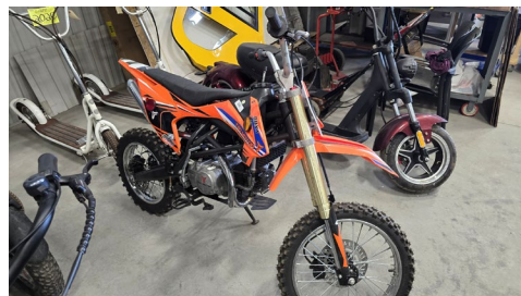
Motocross Tao, mod. DBX1