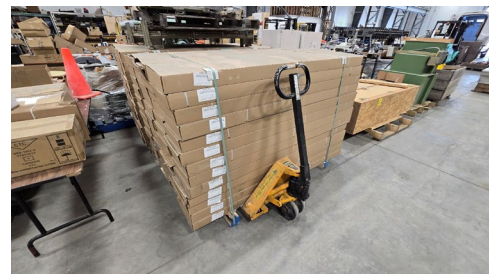
Merisier authentique Birch 5" 1/2 HS

Liste partielle, sujet à changement sans préavis