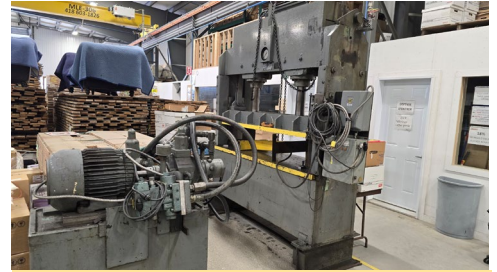
Presse hydraulique Kor Wilson, 2018, cap. ± 100 T., 18" profond x 72" large