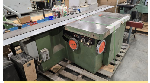
Banc de scie à panneaux coulissant Griggio, mod. SC3200