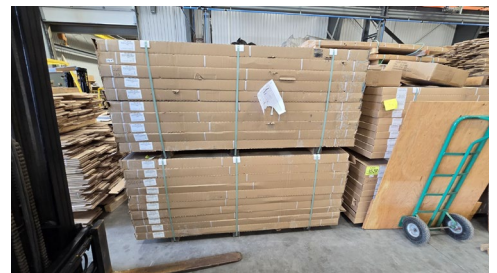
Chêne Red Oak sablé