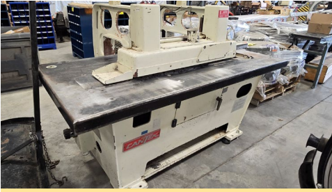
Déligneuse "Bottom cutting straight line rip saw" Cantek, mod. R18, cap. 22 HP