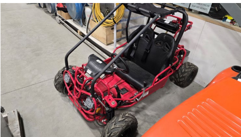
Doom buggy à essence Tao, 2022