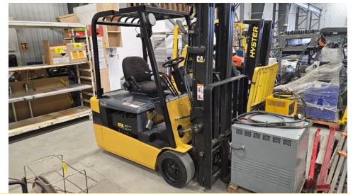
Chariot élévateur électrique Caterpillar ET-4000, cap. 3700 LB, 3 roues, avec chargeur, 9468 H.