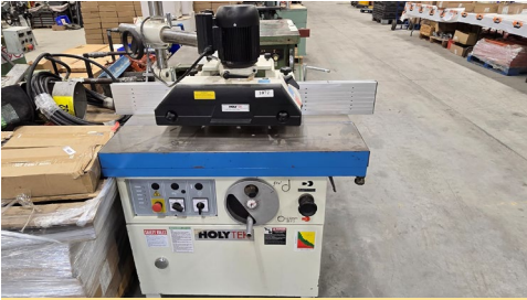
Toupie à table coulissante Holytek, mod. HC-512MSL, 2019, cap. 7.5 HP avec alimentateur Holytek