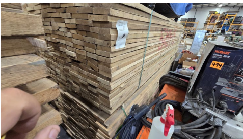
Chêne en planches 4"