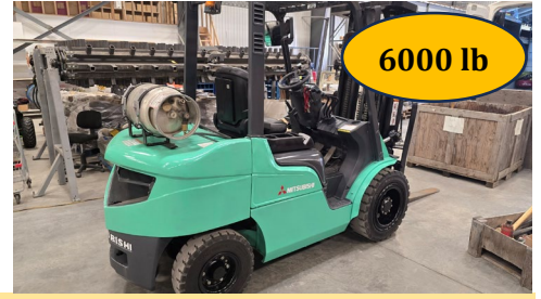
Chariot élévateur Mitsubishi Caterpillar FG 30 N, propane, pneumatique, side shift, 20442 H.