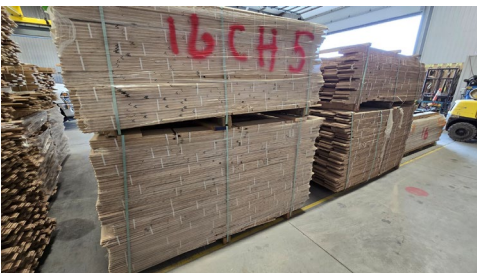
Chêne Rustique 5" 1/4