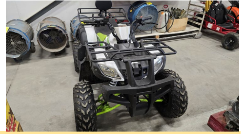
Petit VTT Tao, moteur Bull 200