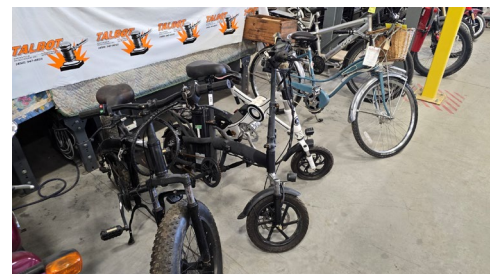
Vélos électriques sport, 850 W. et 1000 W.