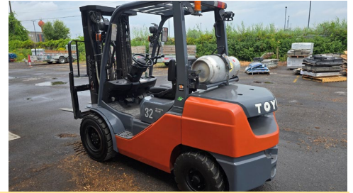
Chariot élévateur Toyota 8FGU32 au propane, mât 3 sections, side shift, élévation 171", cap. 6500 lb, 5043 H.