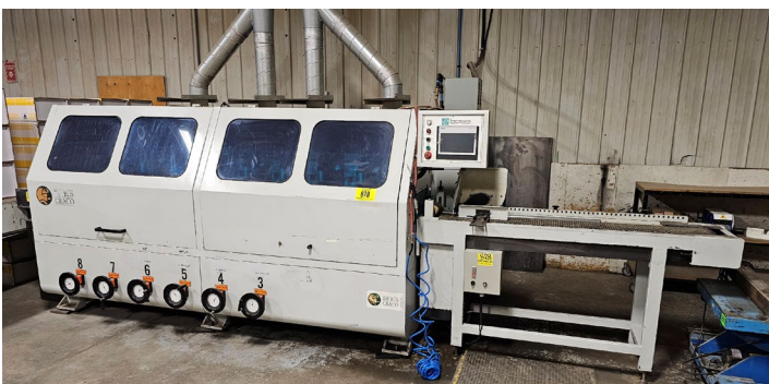
Moulurière à design de surface Taurus Craco, 2017, contrôle Siemens Boss Smart Line, incluant convoyeur d'entrée