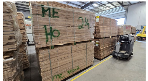
Chêne Pride 2" 1/4