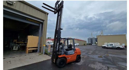
Chariot élévateur Toyota diésel 7FDU35, cap. 7300 LB, 3 mâts, élévation 179", 12860 H.